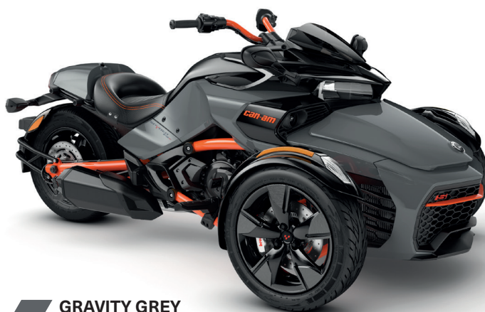
GRAVITY GREY (СЕРЫЙ) В КОМПЛЕКТАЦИИ SPECIAL SERIES

* Трициклы Can-Am разработаны с мыслью о том, чтобы владельцы не испытывали трудностей при обучении вождению и управлению. Ознакомьтесь с требованиями действующего законодательства в части необходимости получения водительского удостоверения на право управления данным транспортным средством в стране вашего проживания. В России чтобы получить удовольствие от поездки на трицикле, достаточно водительского удостоверения на право управления мотоциклами.