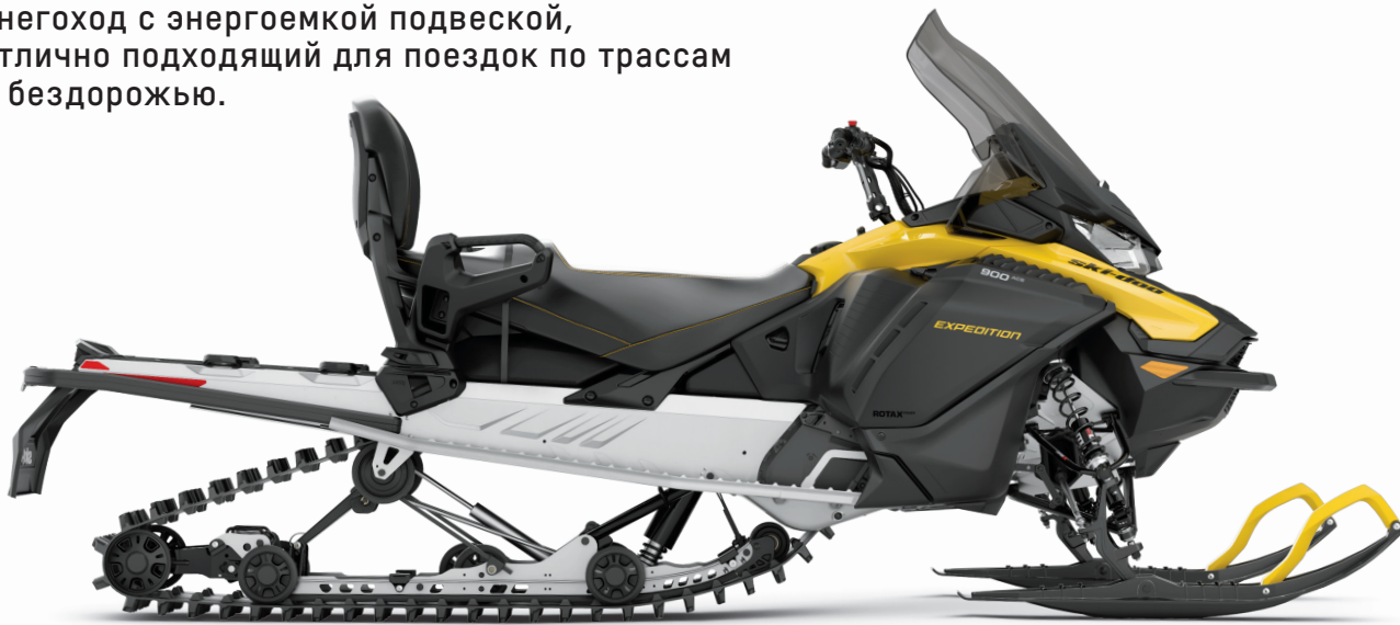
МОДЕЛЬ EXPEDITION SPORT 900 ACE

Двухместный спортивно-туристический снегоход с энергоемкой подвеской, отлично подходящий для поездок по трассам и бездорожью.